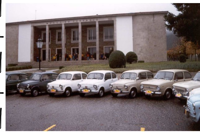
HOJE À PORTA DO MUSEU. UM DIA QUEM SABE, LÁ DENTRO...

Um ano mais tarde o encontro deu-se na Vila do Caramulo, localizada na serra que lhe deu