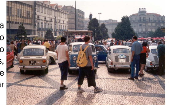
A RECEPÇÃO NA PRAÇA DA BATALHA

Para testar os bólides, realizou-se uma gincana nos terrenos do antigo parque de exposições da Vila Nova de Gaia.