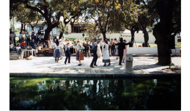
Antes do encerramento, a actuação do Rancho Folclórico.