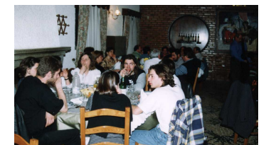
Jantar de sábado - seguiu-se uma agradável noite de fados.