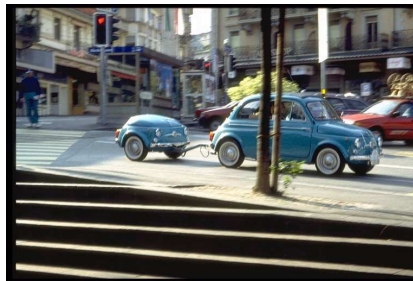
Uma das muitas fotografias sobre os nossos carros disponíveis na Internet

Chegaram já certamente à conclusão, todos que estão habituados a navegar na Internet, que é fácil encontrar páginas viradas para os modelos representados no nosso Clube. A grande profusão de páginas disponíveis, é prova da simpatia de que são alvo estes modelos Fiat. Se a grande maioria, são páginas de clubes da Europa, há também páginas de outro tipo de organizações e até mesmo páginas pessoais com grande interesse. O nosso boletim irá acompanhar este tipo de informação, propondo aos sócios a consulta de páginas que mereçam uma visita especial. Iremos sempre que possível fornecer novos endereços,