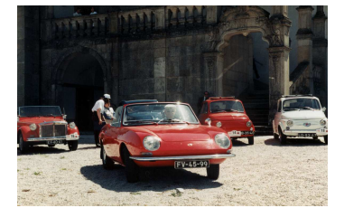
Alberto Carvalho arrecadou o prémio do melhor 850

apoia as suas iniciativas. Entre outros apoios, cederam quatro versões diferentes dos novos modelos 600 e uma Múltipla, estes serviram não só para apoiar a concentração, mas também para lembrar que o velho mito “600” desafia os novos tempos.