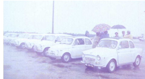
A chuva não dissuadiu os participantes.

durante toda a manhã não dissuadiu os participantes, vindos de Coimbra, Aveiro, Montemor-o-Velho, Gala e naturalmente Figueira da Foz.