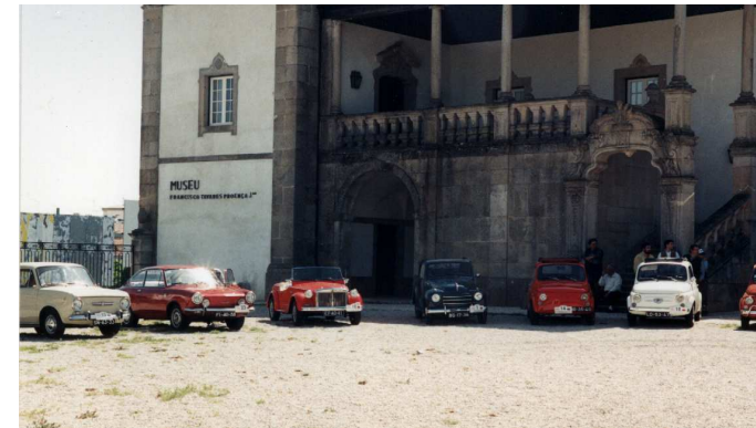
Frente ao Museu Francisco Tavares Proença Júnior

A cidade de Castelo Branco acordou no dia 10 de Abril deste ano, com a presença de pequenos cidadãos italianos. Espantados, os albi-castrenses que já não viam tantos carros destes juntos, já vai para muitos anos, acorreram ao Passeio Verde, mesmo no centro da cidade, onde puderam apreciar em pormenor todos os modelos ali concentrados. Na verdade, responderam à chamada vários sócios do nosso Clube, vindos de Lisboa, Cascais, Amadora, Coimbra, Figueira da Foz, Porto, Maia, Abrantes, Albufeira, Covilhã e claro está de Castelo Branco. Aos sócios do clube juntaram-se outros convidados, vindos de paragens mais longínquas, como é o caso da bonita cidade espanhola de Vigo. Quanto aos modelos representados, constituíram um leque variado. Um maravilhoso “Topolino” azulão e cheio de charme, um lindíssimo 850 Sport Spider, descapotável a fazer inveja a todos que o viam passar, um Siata Spring (plataforma do 850), espantosamente vermelho, um 850 normal rigorosamente impecável, um 850 sport coupé, vários 600, merecendo especial destaque um descapotável de 1956, provavelmente o exemplar deste modelo mais antigo do nosso país. Dentro dos 500, havia para todos os