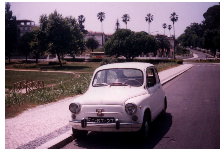
O 600 D “Esculápio” de 1968. Um ano depois a Fiat deixava de fabricar o lendário modelo.