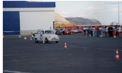
O 600 no seu melhor em Porto Santo

(2ª passagem) conseguindo uma diferença de 8 décimos de segundo entre a primeira e a segunda passagens.