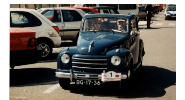
O prémio do melhor 500 foi para Luís Sequeira Pereira