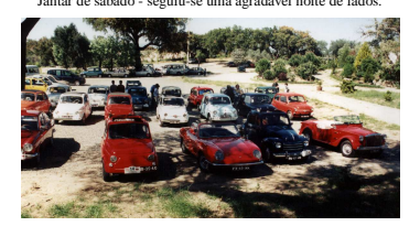
Aproveitando as sombras da Quinta da Dança