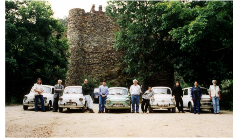
"Olha o passarinho" - O Castelo da Lousã em fundo.

Castelo e Zona do burgo e Piscinas naturais.