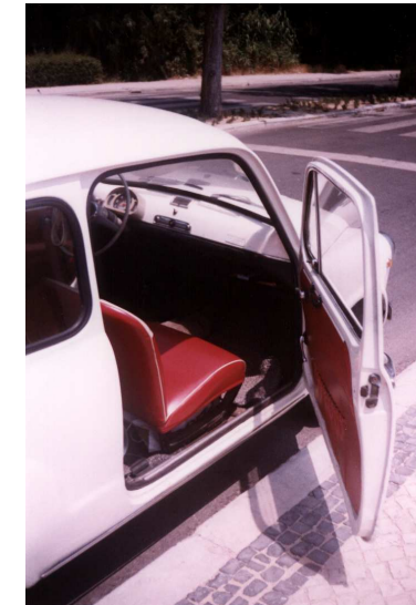
Podem ver-se o interior do 600, ainda com os estofos originais.

A sua proprietária é peremptória em afirmar: «Nunca o venderei. Já me ofereceram, há uns anos, 700 contos por ele, depois de ter levado um ligeiro restauro em 1990, mas nem por todo o dinheiro do mundo... ! Já faz parte da família!».