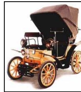
4HP o primeiro automóvel fabricado pela Fiat

Os primeiros automóveis são criados em meados do ano 1880 pelos engenheiros alemães Gottlieb Daimler e Karl Benz. Menos de vinte anos passaram até surgir em Turim a primeira fábrica da Fiat. Em 1902 entra em Portugal o primeiro modelo da Fiat, era um 12HP do Infante D.Afonso. Inscrito na primeira prova automobilística realizada na Península Ibérica, o já clássico Figueira da Foz-Lisboa viria a conquistar o 1º lugar. Também na primeira prova de velocidade realizada em Portugal, o 1º Quilómetro Lançado da Valada, Carlos Bleck vence ao volante de um Fiat 24-40HP. É sem dúvida um acontecimento notável para a época e este mesmo Fiat passou a figurar, oficialmente, como o carro mais rápido de Portugal,